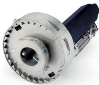
RL60FC 1 und.